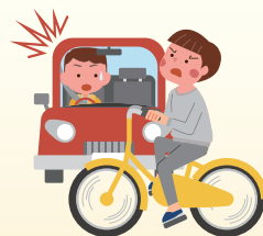
③ 自転車で帰宅途中、 車にはねられた！