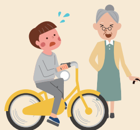
⑤ 自転車を運転中 歩行者をはねてしまった！