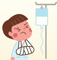
② 仕事中腕を骨折した！