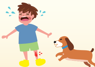
① ペットの犬に 噛まれた！